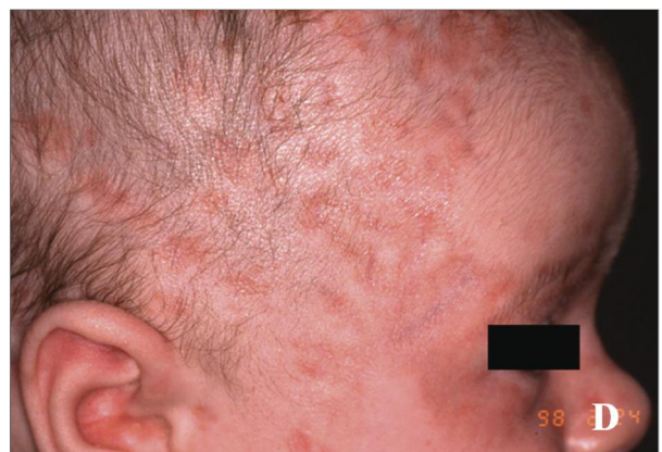
FIGURA 1. Distribuição preferencial das lesões cutâneas no Lúpus Eritematoso Neonatal