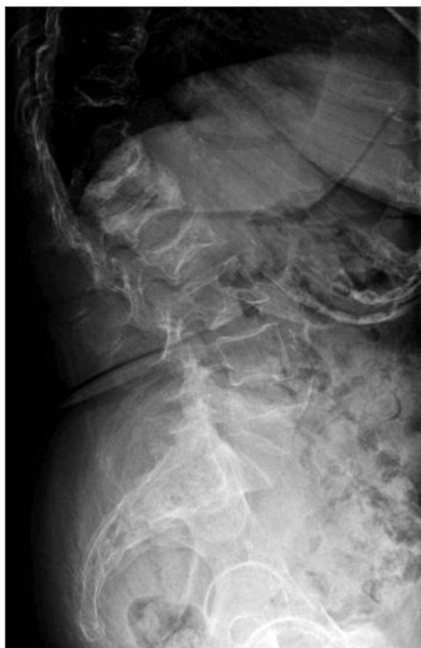
FIGURA 6.1. Controlo radiológico da coluna lombar sem evidência de novas fracturas

nhava com o apoio de apenas uma bengala, referia maior facilidade nas AVDs, já não apresentava humor deprimido e negava mesmo queixas algicas relevantes. A doente suspendeu o tramadol por sua iniciativa mantendo apenas tratamento com anti-inflamatório.